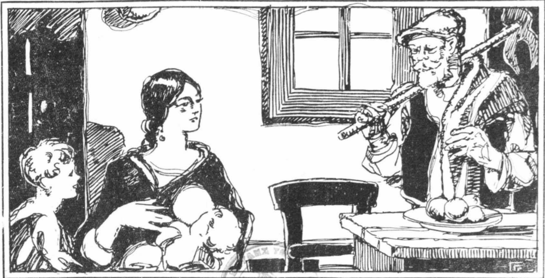
Ο ΠΥΡΙΣΜΟΣ ΤΟΥ ΠΑΤΕΡΑ