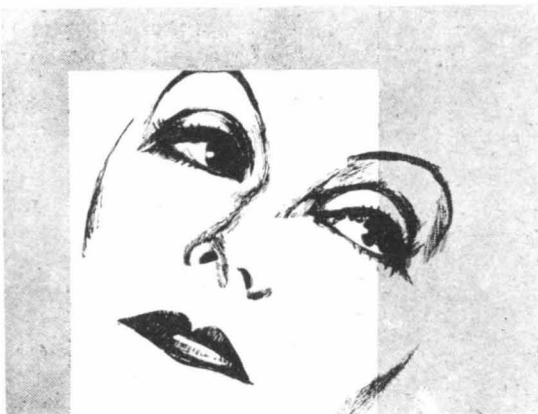
Η Γκετα Γκάρμπο (Τελευταίο έπιτυχεσάτο ακτίο της)

άνιέλαμάνθη τών κηάδων που δάτηρε. Κορψις ζώτων να ζωή ούτε λαπτό, πησέξι στη βενζι- νάκιό του κι' έτριέξι σε βήθειά της. 'Η διασσίς της όμως δέν ήταν εύκολο πράγμα. 'Ο νεαρός έρωτιεμένος μόνι χωρίς στή δι- ναμία, που τού έδωσε ο φι- λεργος έρωτάς του, κατορθώσε ν' άνιέξη στην παλή με τά τε- ράστια κήματα, να παρόσει την Μόρην Ο' Σουλβαν και να τήν σπώη. 'Ηταν δε καιρός, γιατί η άτιχη «βεντέττα» είχε άρχισί να γάνη τις δυνάμεις να άσφα- λίσω θα βοηζώτασ μέσα στο τρι- μαχτικό χάος τών κηάτων. 'Ο Λέα 'Ατζανσον είνε σήμερα ο καλύτερος κι' ο πιο άγαπημένος φί- λος της Μόρην Ο' Σουλβαν.