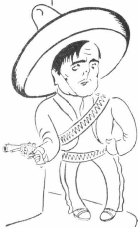
Ο Λέο Καρίλλο

ματα. "Όσο για μένα; Πέταγα στὸν οὐρανὸν κάθε φορά πὸ μὲ χειροκροτοῦσαν. Μὰ δὲν ἄργησε νὰ βαρεθῶ καὶ τὴν δόξα τοῦ θεάτρου. Ἐφ'ὅσον γύρισα λοιπὸν ὅλα τὰ θέατρα τῆς Νέας Ὑόρκης, τὸ 1913 ὑπέγραψα ἕνα συμβόλαιον μὲ τὴν «Φίλιμ Κόμπανου» γιὰ πέντε γρόνια κι' ἄρχισα νὰ παίξω στὸν κινηματογράφο. Τὸ τυχοῦστικὸ ζῆλος πνεῦμα μου δὲν μ' ἔσφηνε σὲ ἡσχία. "Ἦλεκα τώρα νὰ κάνω μακρὴν ἀφείδια καὶ νὰ δῶ ἀγκυρῶστες καὶ μυστηριώδεις χάρες. Γι' αὐτὸ, μόλις τέλειωσε τὸ συμβόλαιό μου, δέχτηκα πρόθυμα τὴν πρόταση μιᾶς ἄλλης κινηματογραφικῆς ἑταιρείας, ποὺ ἐπρόκειτο νὰ «γυρίσῃ» ἕνα πλῆθος ἐπιτημονικῶν φιλμ σ' ὅλες τὶς πολιτείες τῆς Ἀνατολῆς. "Ἐπειτα ἐπέσκεψθηκα τὴν Ἰαπωνία καὶ ξαναγύρισα κατόπιν στὴν Ἀμερική, ὅσοι ἀπὸ ἀποῦσια πολλῶν χρόνων.