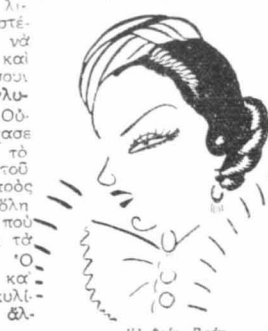
Ἡ Φαίη Βραϊή

Μιά μερὰ πάλι αὐτὸς ὁ μεγάλος «ἀστέρας» τῆς «Μέτρο» ἐνῶ «γύριζε» σὲ μιὰ ζούγκλα τῆς Αὐστραλίας μερικὲς σκηνὲς ἐνῶ φιλμ. Ἐγινε τὴν ἐπιθεσί ἕκκα λιονταριῶν. Ὁ σκηνοθέτης οἱ «ἀστέρες», οἱ κουπάσοι, ἄρχισαν νὰ τρέμουν ἀπ' τὸ φόβο τοῦς καὶ προσπαθοῦσαν νὰ σκαρφαλώσουν ἀπὸ γύρω δένδρα γιὰ νὰ γλυτώσουν ἀπ' τὸν θάνατον. Ὁ Ουάλλας Μπέρου ὅμως δὲν ἔχασε τὴν ἠνθρωπιά του. Ἐβῆλε τὸ πιστόλι του, πῶς τὸν τηλεθέσαστο σκηνοθέτου καὶ ποσῶν ἄρχισε ποὺς τὰ λεπτοῦσια φωνάζοντας μ' ἄλη του τὴ δύναμι. Ἡ σκηνὴ του, ποὺ γινόταν ἔτσι τρομερῶ, ἔκαμε τὰ λιονταρία νὰ ὑποχωρήσουν. Ὁ Ουάλλας Μπέρου τὰ σημάδεψε καὶ πυροβόλησε. Ἐν' ἀπ' αὐτὰ, κυλίστηκε κατὰ γῆς νεκρὸς, ἐνῶ τ' ἄλλα ἔφευγαν τρομοκρατημένα.