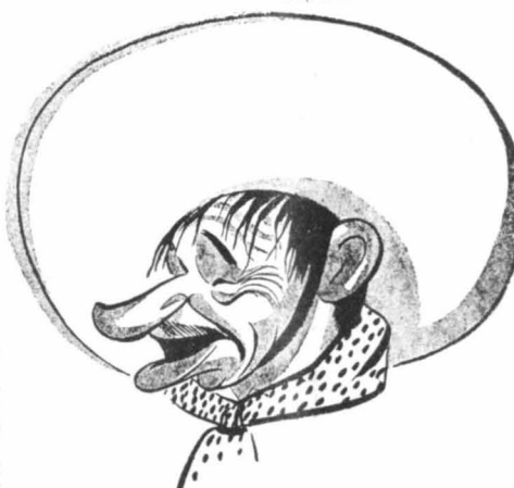
Ο Ουάλλας Μπέρου στὸ «Ζήτω ὁ Βιλλὰς I», τὴν περίφημη ταινία, ποὺ βραβεύθηκε στὴ Βενετία.