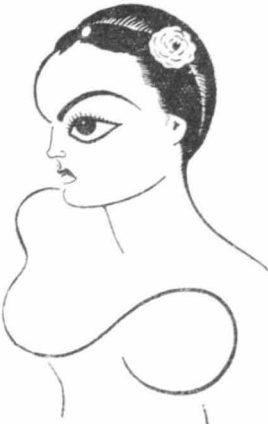
Ἡ Κάθριν ντε Μιλ

Μιά μερὰ πάλι αὐτὸς ὁ μεγάλος «ἀστέρας» τῆς «Μέτρο» ἐνῶ «γύριζε» σὲ μιὰ ζούγκλα τῆς Αὐστραλίας μερικὲς σκηνὲς ἐνῶ φιλμ. Ἐγινε τὴν ἐπιθεσί ἕκκα λιονταριῶν. Ὁ σκηνοθέτης οἱ «ἀστέρες», οἱ κουπάσοι, ἄρχισαν νὰ τρέμουν ἀπ' τὸ φόβο τοῦς καὶ προσπαθοῦσαν νὰ σκαρφαλώσουν ἀπὸ γύρω δένδρα γιὰ νὰ γλυτώσουν ἀπ' τὸν θάνατον. Ὁ Ουάλλας Μπέρου ὅμως δὲν ἔχασε τὴν ἠνθρωπιά του. Ἐβῆλε τὸ πιστόλι του, πῶς τὸν τηλεθέσαστο σκηνοθέτου καὶ ποσῶν ἄρχισε ποὺς τὰ λεπτοῦσια φωνάζοντας μ' ἄλη του τὴ δύναμι. Ἡ σκηνὴ του, ποὺ γινόταν ἔτσι τρομερῶ, ἔκαμε τὰ λιονταρία νὰ ὑποχωρήσουν. Ὁ Ουάλλας Μπέρου τὰ σημάδεψε καὶ πυροβόλησε. Ἐν' ἀπ' αὐτὰ, κυλίστηκε κατὰ γῆς νεκρὸς, ἐνῶ τ' ἄλλα ἔφευγαν τρομοκρατημένα.