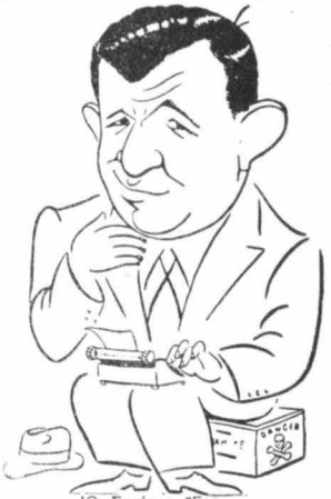
Ο Στούαρτ Ἐρβιν

Αὐτὸ τὸ ταξεῖδι μου ἐν τούτοις στὰ βάθη τῆς Ἀνατολῆς, μοῦ θεράπευσε καὶ τὸ πάθος μου γιὰ τὰ μεγάλα ταξεῖδια. "Ἐτσι κατῳρίσθηκα νὰ... ριζώσω σὲ μιὰ ἑταιρεία καὶ νὰ μὴ θέλω πιά τίποτ' ἄλλο, παρὰ νὰ ἠσυχάσω καὶ νὰ ξεκουρασθῶ κοντὰ σ' ἄγαπημένα πρόπαια μου. Ἔννοεῖται ὅτι δὲν ἔπαφα καθόλου τὴν κοπιαστικὴν ἡδουεῖα τοῦ «σοῦντιου». Αὐτὸ τὸν τελευταῖο χρόνον, «γύρισα» τέσσερα φιλμ, μεταξὺ τῶν ὁποίων καὶ τὸ «Γκράντ Ὀ-τέλ». Ἐδῶ κι' ἐγὼ λίγο καιρὸ ἀποτέλειωσα τὸ φιλμ «Ζήτω ὁ Βιλλὰς», τὸ ὁποῖο πραγματικῶς σημείωσε μεγάλη ἐπιτυχία. Ποῖος εἶνε αὐτὸς ὁ Βιλλὰς; "Ἐνας θρυλικὸς ἥρωας τοῦ Μεξικικοῦ, ποὺ τὸ 1910 τὸν ἔκουγαν ὅλοι οἱ Μεξικανοὶ καὶ τὸν λατοῦσαν ὡς ἄν θεὸς τοὺς καὶ τέλος τὸν σκότωσαν τὸ 1923. Ὁ ἔνδοξος ἥρωας πέθανε μ' αὐτὰς τὶς λέξεις, ποὺ δείχνουν ὅτι δὲν ἤμισε καθόλου τοὺς παλαιὸς φίλους του: «Ἄντιο Μεξικό! Συγχέθηκα τὰ κρίματά μου. Σκέψου μόνον ὅτι ἂν ἀμάρτησα, τὸ ἔκανα γιὰ σ' ἄγαποῦσα πάσα πολὺ!» Αὐτὴ εἶνε ἡ τελευταία δημιουργία μου.