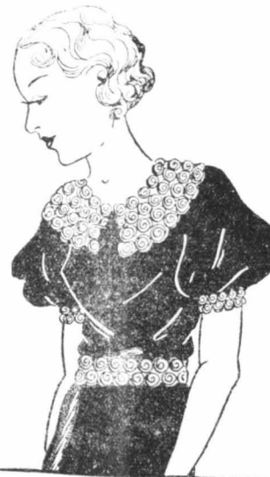
ΤΑ ΝΕΑ ΦΙΓΟΥΡΙΝΙΑ

Κον Β. Σ., Ἐνταῖθα.—Ἐῖνε σὰσ σιμιστῶσ λατοῦ- τῆσ ἰσοροδοῖεσ ἀκτινεσ, δὲν βλέπο τὸ λόνο γιατί νὰ μὴν τῆσ γάνετε, φράνε νὰ σὰσ ἴνουν ἀπὸ εἰδῶν. Τὸ φάροσμο ποῦ σὰσ σιμιστῶσ εἶνε ἀπὸ τὰ σιμψι- σιμια κατὰ τῆσ τοκοτατόσσεσ. Σὲ ποσηγοῖμενο σφύ- λο τοῦ «Μποικεῖτοσ» ἔχω σιμιστῶσ ἄλλο, ποῦ ἀπο- τελεσματοῦτερο. Γιά τὰ ἑτοιμάσετε παντοῦ με ἐσ- σάνεσ, ἂσ ἔσὲ γοφῶσ τὸν τρόπο σὲ ὀκείμενο σφύλα τοῦ «Μποικεῖτοσ». H ΦΙΛΗ ΣΑΣ