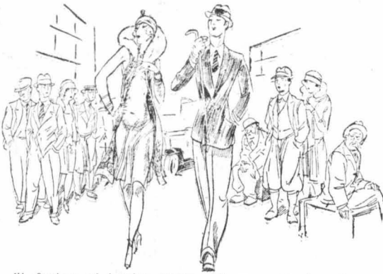
Η «βεντέτα» κι' ο «γόης» περνούν περήφανοι, κομφοί, εύτυχημένοι...

Από τους άνδρες λοιπόν ο μολογώ, ότι μου έκανε μεγάλη έντύπωσι ή δειλία και ή συμπαιθητική σεμνότης του Κλάιρκ Γκαϊμπτλ. Ο νέος αυτός τύπος του Δόν Ζουάν που παρουσιάζεται στην θόνη ως ένας «τολμηρός και θαρραλέος άνδρας που δέν μπορεί νά τόν έμποδιση τίποτα, είνε στην Ιβιστική του ζωή ο πιο ήσυχος κι' ο πιο μετρίφρανος άνθρωπος του κόσμου. Ποτέ δέν μιλάει γιά τόν εαυτό του και ποτέ δέν κυττάζει τις γυναίκες μέ μύκι κατακτατού. Και σ' αυτό άκριβώς έγκειται ή γοητεία του. «Όλος ο κόσμος τόν λατρεύει, γιατί δέν επάξει» τόν Δόν Ζουάν και στη ζωή. «Όπως έλοι οι μεγάλοι καλλιτέχνες είνε άπλόος, σεμνός και... συμπαιθηκτικώτατος.