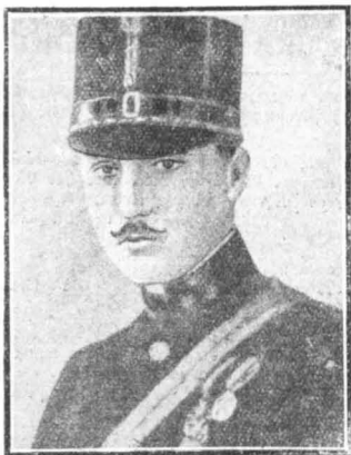
Ο 'Αρχιδούξ Λεοπόλδς των 'Αψβούργων