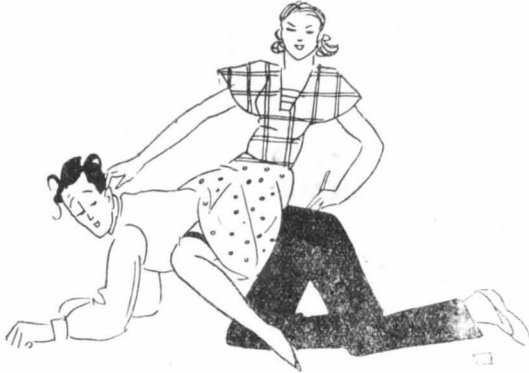
«Να ανέχεσαι τας συνεπείας του γάμου άνογγύστως !...»

Άγαπητό «Μπουκέτο», Η απάντησις στο ερώτημά σας δεν μπορεί παρά να είνε φυσικά έντελώς ύποκειμενική, ανάλογως των προτιμήσεων καθενός. Έγώ έχω τη γνώμη ότι στη σημερινή μεταπολεμική εποχή, που έχει χρεωκοπήσει κάθε ήθικη αξία και που ό νομιμσμός έχει τόσο ολέθρια επίδρασις, πρέπει να άποφεύγονται ή ακρότητες. Θέλετε τώρα την γνώμη μου ; Όπως θα ίδητε, δεν είμαι και πολύ άπαιτητική. Τον σύζυγό μου τον θέλω να είνε μορφωμένος, ευγενής στους τρόπους και με κάποια ύλική ανεξαρτησία. Πλούτη μεγάλα δεν έπιθυμώ, γιατί στον πλούτο δεν στηρίζεται ή ευ-