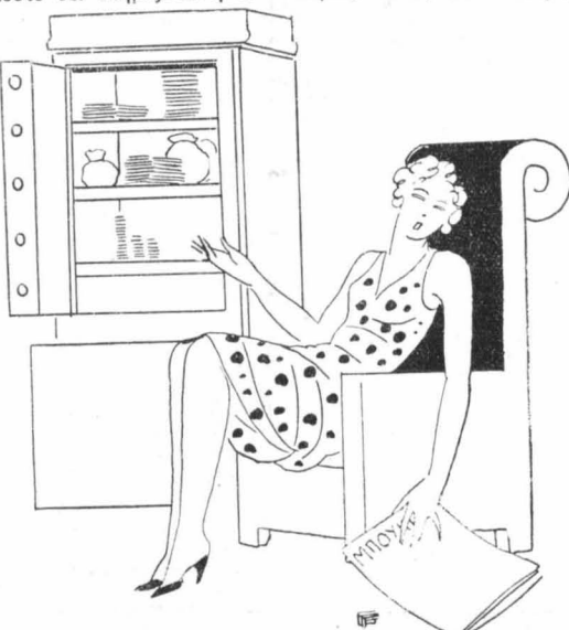
«Δεν χρειάζεται να έχη περιουσία. Έχω εγώ !...»