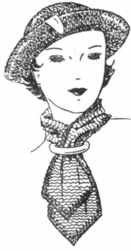
ΤΑ ΜΟΝΤΕΡΝΑ ΚΑΠΕΛΛΑ