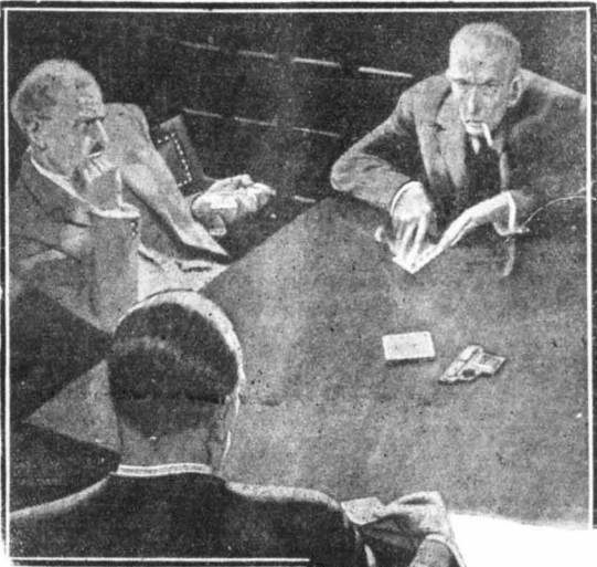
'Ο Ντηλάνεϋ γύρισε τό χαρτί του. 'Ηταν τό ένένα κούττα !..