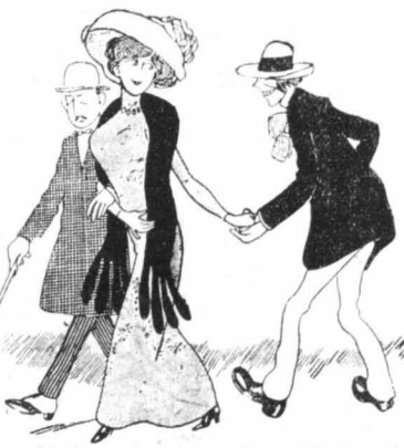
...Θα της πασοάρω το τρωερό μου ραβασιώ...