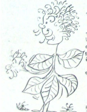
Ἡ «κολλητοῖδα», πού κολλοῦν στῶν προβάτων τὰ μαλλιά καὶ στὶς παντέλλες τῶν φουστανιῶν τῶν κοριτσιῶν