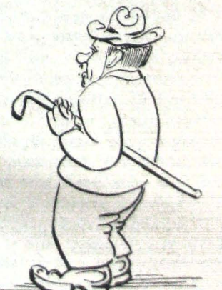
Στωϊκὸς τῆς συγχρόνου ἐποχῆς