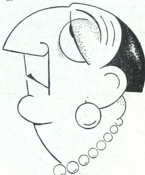
'Η Γαλλίς Βεντέττα τού κινηματογράφου Μαργαρίτα Μορένο

'Ο Μπάστερ Κήτον, ό «κωμικός πού δέν γελά», βρίσκεται τώρα στό Παρίσι, προκειμένου νά «γυρίση» — όπως, έξ άλλου, έχουμε αναγγείλει από καιρό στους αναγνώστες μας — τó πρώτο του Γαλλικό φίλμ, με τόν τίτλο : «'Ο Βασιλεύς τής Λεωφόρου 'Ηλυσίων Πεδίων». Οί Παρισιοί, πού τού έκαναν θερμή υποδοχή, στραβομουτσούνισαν όταν