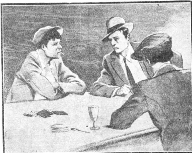
Τρεις κακοποιοί κατέστρωναν τα σχέδιά τους για τη διάρρηξι μιας Τραπεζής