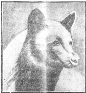
Μιά μικρή σταχτιά άρκουδα

—Η Άθήνα νά έλευθερωθή. Τά μέσα τού στρατοπέδου νά μη λείψουν, και εγώ πρώτος νά δεχθώ ομόθυμους άρχηγόν λ..»