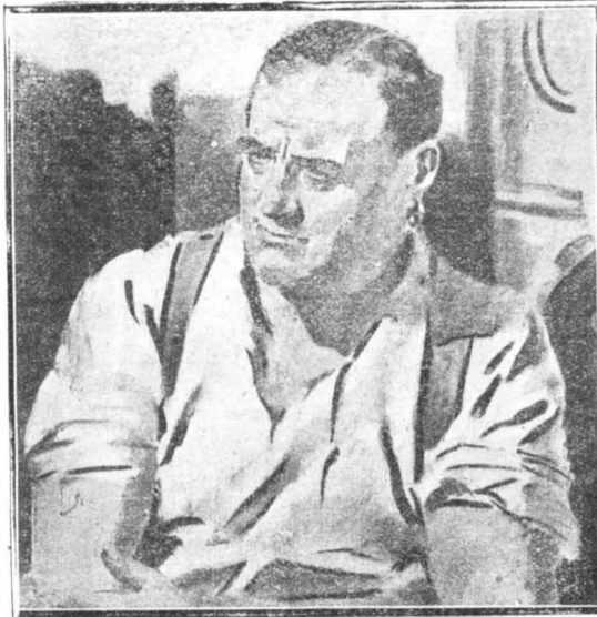
Ο λαθρέμπορος χαμογέλασε με περιφρόνηση...