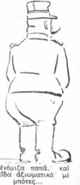
Τὸν ἐνόμισα παπᾶ, και τὸν εἶδα ἀξιοματικό με μπότες...