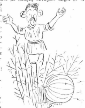
Κηπουροί βγαίνουν μέσα ἀπὸ τὰ ἀποφυλλομένα κλαρικά τους...