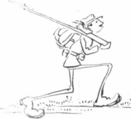
—'Εν-δυό, ἔν-δυό !...