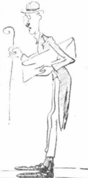
Καλλιεργεῖται τὸ φρούτο ἀπὸ μέσα στὸ Ἑλληνικὸ περιβάλλον...

Μιά μέρα, εκεί που έκστρατεύαμε εαί'νός, με τὸ κεφάλι ὑψηλά και με τὰ μάνιχερ ἐπ' ὤμων, ἐναντίον ἐχθροῦ...φαναταστικῶ, βραδίζοντες πρὸς τὰ βουνά, γιά ψευδομάχη, ἄξιανα τὸ ἔδαφος ἐθρόσε κατὰ ἀπὸ τὰ πόδια μας, σάν νά συνεταράχθη, σάν τὰ λιθαράκια και τὸ χώμα νά ζωντάνεψε και ν' ἀνεπήδησε.