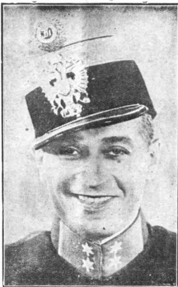
Ο Μωρίς Σεβαλιέ στο «Ονειρώδες Βάλς»

Ο Μωρίς έχει ακόμη και μία αδυναμία: συμπαθει τις μικρόβυλες χορευτήρες που έρχονται απ' όλο τον κόσμο για να κάνουν την τύχη τους στο Χόλλυγουντ. Κι' επειδή όλες δέν προλαμβάνονται στον κινηματογράφο, υποφέρουν και δυστυχούν στην πόλι των «αστέρων» και τέλος αναγκάζονται να