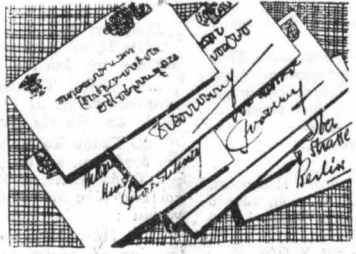
Μερικὰ γράμματα μὲ τὸ Ρωσσικὸ αὐτοκρατορικὸ οἰκόσημο...

Ὁ Φρέντυ ἐφοροῦσε μὲ χάρι τὸ φανταχτερὸ κοστούμι του, καὶ μ' ὅλο πὺ ὁ χρόνος, ἢ μᾶλλον ἡ Ἐρυθρὰ ἐπανάστασις εἶχε κάνει μέσα στὴ φρικὴ τῆς νὰ ξεχα-