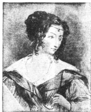
Η αοιδός Μωπέν

—Τότε, για να μην φορησουν, στείλτα στο άπορωγείο, να ... φάνε αυτούς που δέν ξέρουν τί διατάζουν !..