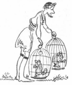
'Ο κόσμος έρχότανε φορτωμένος φόβο της, και από μία νυφίτσα. Χαριτωμένα ζώα, κομψά και λυγρά...

'Επειδή όμως ποντίνα στα γραφεία της Γεωργικής υπηρεσίας