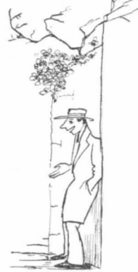
-Τι καλλιγαννούδες είναι αυτές ;

Ο δασονόμος, έπειδή ή διαταγή των ύπουργείων είνε ιερές, έσπευσε να κοινοποιήσθ το χαρισμένο άγγελμα στον λαό της υπαίθρου χώρας, χωρίς να συνεννοηθ ή με καμιά άλλη άρχή, ούτε με τόν δηριθέντα ως νυφίτσα παραδέντην προοιζόμενο της Γεωργικής υπηρεσίας του Νομού.