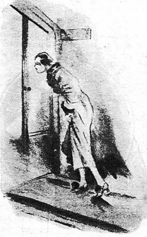
Ή Μαριάννα μπήκε μέσα βιαστική!...

Ή Ίνγκε κοκκίνισε μέχρι τίς ρίζες των μαλλιών της. Ο κύριος Σάπς της είπε μερικά ευγενικά λόγια ακόμη και, όταν στο μεταξύ, ο θυρωρός τόν είδοποίησε, πως τό αυτόκίνητό του