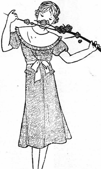
ΓΙΑ ΤΑ ΚΟΡΙΤΣΑΚΙΑ ΣΑΣ

Όραιότατο φορεματάκι για κοριτσάκι 10-14 έτών, από ύφασμα σιελ υπέλε και άσπρο. Γαρνίρεται μ' ένα μεγάλο γιακά από κρέμ-νε-οιν λευκό, που τελειώνει με πλισοέ. Η φούστα εινε κλόδ και τά μανικάκια φοουσκιά.