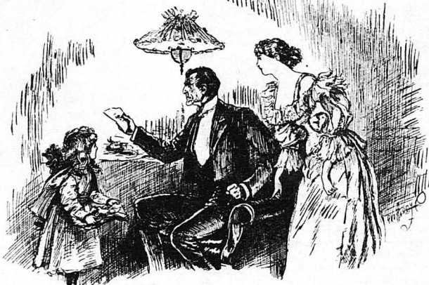
—Αυτό τó χαρτί πού τó βρήκες, μικρή μου ...