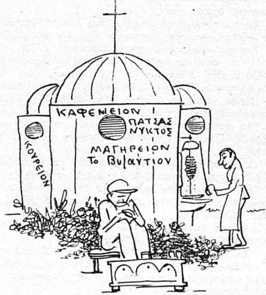
Τού βάλανε στην κορυφή ένα σταυρό...