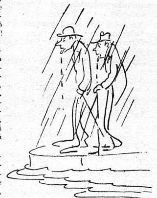
Και τρέχουνε τά σόλια τους...