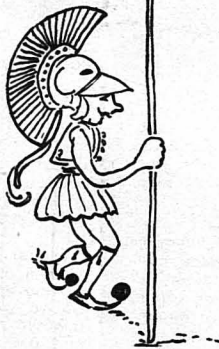
Ότι βγάζει διά μέσου των αιώνων ή Έλλάς...