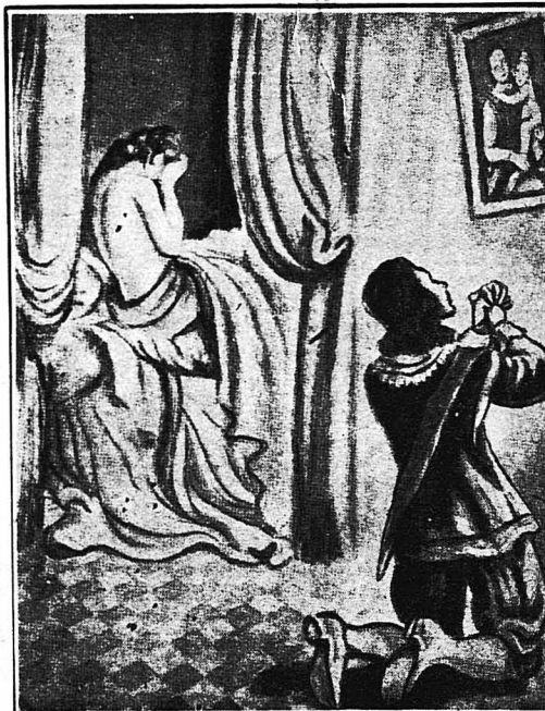
Πήγαινε και γονάτιζε μπρός στις εικόνες...

Παρ’ όλες τις προσπάθειες του, ο ‘Αριάνδος δεν μπόρεσε να καταστήση τη γυναίκα του άπόσβουλη από κάθε ταπεινό πειρασμό... ‘Η ανεψιά του Μαζαρίνου, δηλασμένη από τη διαγωγή τού συζύγου της