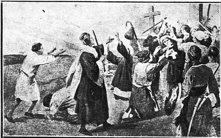
Η άφαγή των Χριστιανών προσκυνητών από τους Μουσουλμάνους στην 'Ιερουσαλήμ

"Αποτέλεσμα του άνισου αυτού άγδου—πώς μπορούσε να τα έγάλη πέρα