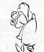
Οι Βούλγαροι κάτοικοι είχαν φύγει