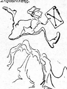
Δρασκελώντας δρη και βουνά !...