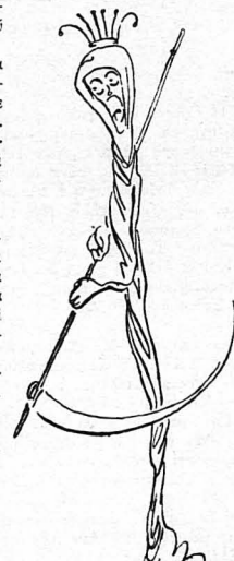
'Η χολέρα !