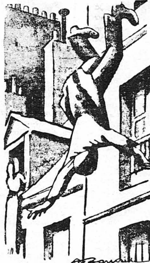
Ο κ. Πιθουάν ρίχτηκε στο κενό...

Πέρασαν έτσι μία, δύο, τρεις μέρες... Η μοναξιά και ή σιωπή έκαναν τήν άγωνία του νά μεταβληθί σε παροξυσμό. Από τόν καιρό πού έλασε κάθε έπαφή μέ τόν έξω κόσμο, ένα σωρό ύποθέσεις και είκαστες βασάνιζαν τού μυαλό του. Τίποτα δέν μπορούσε νά τού ξεριζώσει από τού νού τήν πεποί-