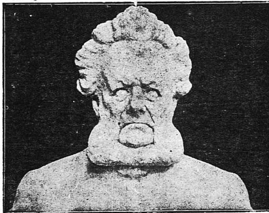
'Ο Νορβηγός δραματογράφος 'Ερρ. 'Ιψεν

—Έχω σοβαρούς λόγους νά πιστεύω πώς ο Μτρίων είνε ο φονιάς, πρέπει όμως νά βεβαιωθώ πώς δέν είχε συνενόχους. Σέ μάς άπέδειξε