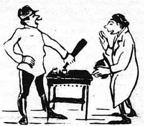
—Άκόμα ένα ποτηράκι ;...