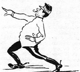
—...Είκοσι μέρες φυλακή !...