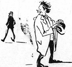
—Φαίνεται πως τό άρθρο τόν πειράσε πολύ... —Έύχαριστώ !... —Κι' άλλο ένα άκόμα ; Ναι ; Κι' άλλο ένα ; Έλα, πέ τό κ' αΐτό, γιά νά τσογγροσώμε. Μ' αΐτό είναι Θεός !... Πίνει, πίνει κανείς, γορίζ νά τό καταλαβαΐναι !... Καλά έκαμες και ήδες. Κάποτε νά ποΐμε λίγο, κ' από γνώμις όσες θές !... —Εξ' ήγειαν σας, κίριε στρατηγέ... —Εξ' ήγειαν ! Είνε, ξερείς, και Ναζιώτικο. Θεέλις και λίγο σάιρος ; Είνε δασύνα ; Νά πίνη ή μάνα και νά ή δίνη τού παιδιού... Αΐτη ή Νάξος !νε περιδούλι. Είμαι βέβαιος πως μιά φορά κ' έναν καρπό έχει θά ήταν ό Παράδεισος !... Αΐτη τή γνώμη έχει κ' ό Μανωλάκης ό Ναυπλιώτης... —Άκόμα ένα ποτηράκι ;...