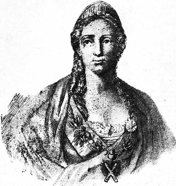
Η Μεγάλη Αικατερίνη

—Δεν φτάνει που μου πήρανε την γυναίκα μου και τον θρόνο μου, θέλουν τώρα να μου