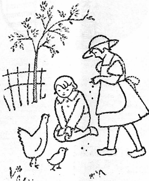
Μοτίφ γιά κέντημα παιδικών άσπρορρούχων. Κεντιέται με άπλή ριζοβελόνη και είνε κατάλληλο γιά να γαρνίρη τραπεζομαντηλάκια, πετσέτες κλπ.