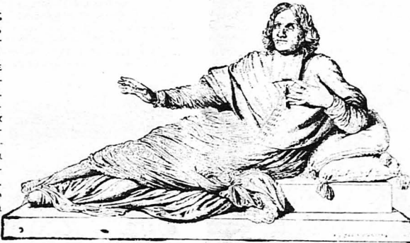
«Ένα άγαλμα του Λαφονταίν