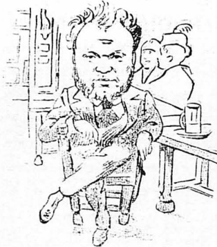
Ο «δαίμονοπληκτος» ποιητής Ζάν Γκουντέκι

Η ταβέρνα της φρίκης και τού τρέμου. Ο φιλόλογος και έναρτετος ιδιοκτήτης της και η ιδιοτροπία του. Οι πελάται της ταβέρνας. Κοσμοπλημύρα και νταραβέρη. Ο Νεκλαπέρ κάνει χρυσές δουλειές. Όπου ε πεύβαινε η άστυνομία. Δυό περιφήμιοι τραγουδιστά της «Ταβέρνας τών Δολοφώνων». Ο Μεζύ κι ο Γκουντέσκι. Το παρελθόν τους. Η δολοφονία τού Ντελαπέρ. Το κλείσιμη της ταβέρνας, κτλ.