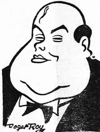
'Ο ήθοποιός του κινηματογράφου 'Ανρύ Μπερλέ

'Ο 'Ινταϊνούφ, ο μεγάλος Ρωσομογγόλος ήθοποιός, ύπόγραψε συμβόλαιο με τήν Ούφρα, προκείμενον να παίξη σ' ένα φίλμ, παρμένο από το «'Εγγλημα και Τιμωρία», το άριστοτεχνικό μυθιστόρημα του Δοστογιέβσκη. Το ρόλο του Ρασοκινάφ θά τον ύποδηή ο ίδιος.