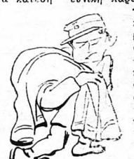
Πάει φορτωμένος μὲ τίς κουβέρτες του...

—Μέσα δω ποὺ εἶμαστε, ἕνα φασόλι ἀξίζει ὅσο καὶ μὴ ἴσθδην. Ἡ ὥρα νὰ περάσῃ μόνον... Ἐρεῖς πόσα ζητήματα μποροῦν νὰ βγοῦν ἀπὸ ἕνα φασόλακι; Ἀκουσε: Φυτολογία, γεωργία, ἔθνικη παραγωγή, ἔθνικη οἰκονομία, γεωλογία, φρεοθεραπευτικὴ, κτηνοτροφία, διατροφολογία, μαγειρικὴ, ὁμοιοπαθειὰ, οἰκιακὴ οἰκονομία, εἰσαγωγὴ — ἔξαγωγὴ οἰκονομικὰ τοῦ κράτους, ἀερολογία, χημεία, οἰκονομικὴ πολιτικὴ, δόκλιχο πρόγραμμα, δηλαδή, ἀγροτικὸ. Χωρὶς νὰ παραλειψομε καὶ τὴ φιλοσοφία!