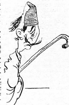
Εἰσήγαγεν ἕναν νέο τύπο στὴν Ἑλληνικὴ σκηνή: τὸν Φασουλή!