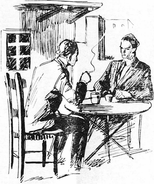
Καθήσαμε στο καφενείο της Δεξαμενής...

—Σ' ένα ξενοδοχείο... Νά, σ'ών «Παρισίων». Κι' άβριο πάλι, θλέπουμε.