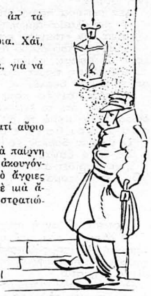
Στὴ σκάλα, ἓνα λαδοφάναρο μεγάλωνε τὸ σκοτάδι!..