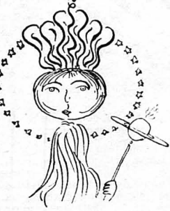
Σωστὴ βασίλισσα τῶν κρεμμυδιῶν !..