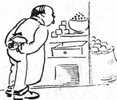
Καὶ οἱ καταστηματαρχαὶ ἀναμετροῦσαν τὰ κέρδη τῆς ἡμέρας...