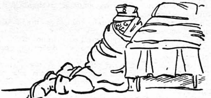
Σὲ μιά ἄκρη, κουλουριασμένως, ὁ στρατιώτης, ποὺ εἶχε ὀρθηθῆ ὡς μάγειρος γιὰ τὴν ἐπομένη!..