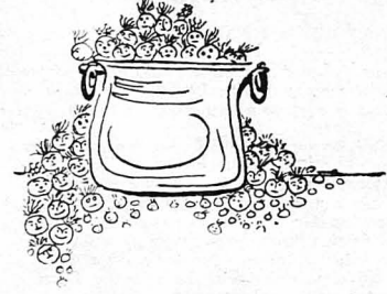
Λαὸς μέγας κρεμμυδιῶν !..