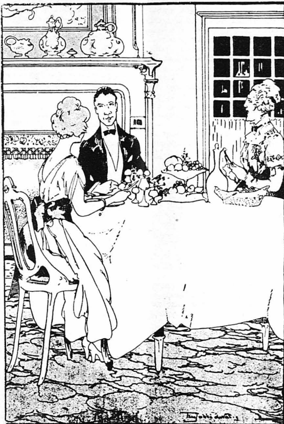
Ὁ Ροβέρτος στὸ τραπέζι ἔκανε διάφορες συστάσεις στὴν Ἀλική...