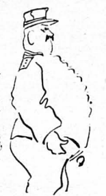
Ού κύριους π ρ ο ε δρους τού Στρατου-λου γικού!...

τού τού γόητρου, ανατίθεται εις τήν φιλοτιμίαν σ’. Τα-λουδέλεια, τούτέστι σαλατά, ανά κι διαβρώνον βα-ραξικαριδιον διαζώνον κι τα λοιπά ιδιόλοια ιννο-ούμενα λ... —‘Εννοια σ’, κ’ηρ ιπλουζία, κι γώ θά τούν ξε-τροπιάσου τού στρατό λ... —Τό πάν είνε να τροφουδοτηθών, μετά τού προ-σέκοντους γόητρου, άπασια, ή άνότιτες άρχες, μάλις τών τών ιπλουζιων άρχων έξημερμένον ιε-ραρχικώς... ‘Ολοι οι νόμοι κι οι προνοήτες κηρίμαν’ εις τούν λαμό σ’ λ... Βάλι με τού νούς κι μέτρα... —‘Εννοια σ’, κ’ηρ ιπλουζία, κι θά σε βγάλω ά-σπρουπρούστου λ... —Βάλι, είπα, κι τού νούς κι μέτρα: ‘Εφορους, ταμίας, πρόεδρος Στρατολογικού Συμβουλίου, σύ παραδεσπός, σύ πος τούν λένε, σύ ίπλουζιος, διά-φοροι ιν τή μεταξύ βαθμιά, γώ κι τόσο άλλοι λ... Για βάλι κι τού νούς, τί μέγα έλιουε έζ’ να λάβ’ χόριον, Πατισούρα λ... —Πηδιά είμαστι, κ’ηρ ιπλουζία; Δέν ξερούμι ή-μεις από αυτά λ... ‘Οσ’ άρνά ιέχου ψήσ’ γώ, άν τάχα, θά μ’να ού πο μεγάλο τούλι-γας σ’ όλη την ‘Αχαρνανα... —Χάιντι, γειά σ’, Πατισούρα, να σι δώ λ... ‘Αλήθεια, μη λημονήσεις κι τ’ς δασκάλους λ... Χά! Για στάσου, μη σπυριόδα, μάλις έχει κι καμιά δασκάλα τού χωριού!... —Ξέρω κι’ γώ λ... —Τούροσί, να μην παραλείψη κανείς λ... *—‘Εννοια σ’, κ’ηρ ιπλουζία! λ... —Χάιντι, Πατισούρα, να σι δώ λ... ***