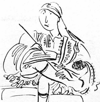
—Γράφι, Κουριμένε ! ...