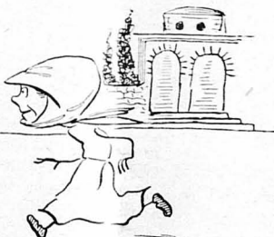
"Όλες ή γυναίκες είχαν χαθή από την έκκλησία !..."