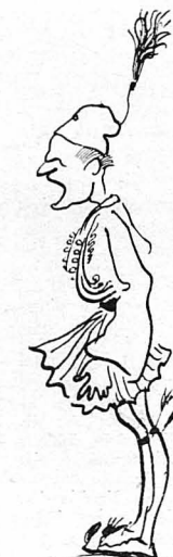
—Τι φταίω γιω ού έβριμος, κύρ έπιλοχία !...

Την ιδέα αυτή ένίσχυσε σωτηριώς και ο έπιλοχίας Μπαταριάς, σωτηριώς για να μήν πάρη και την απόσταση να έτοιμάση και αυτό και όλα είνοντά τού