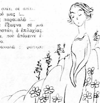
—Πώς ! Υπάρχει και δασκαλίτσα στό χωριό ; ...

Και άφίροντας τις άρχές να κάνουν έπισκέψεις στό σπίτι, τραβήξε προς την 'Απάνω Γειτονία, πού έβριγε τού τριανταφυλί φουστάνι, κοιμίζοντας επροφικη την πρόσκλησιν στό γέναι.