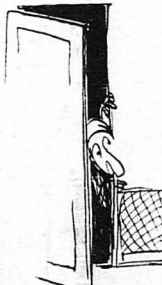
Γυναίκα δέν ε-φάνηκε!...

—‘Εννοια σ’, κ’ηρ ιπλουζία, κι γώ θά τούν ξε-τροπιάσου τού στρατό λ... —Τό πάν είνε να τροφουδοτηθών, μετά τού προ-σέκοντους γόητρου, άπασια, ή άνότιτες άρχες, μάλις τών τών ιπλουζιων άρχων έξημερμένον ιε-ραρχικώς... ‘Ολοι οι νόμοι κι οι προνοήτες κηρίμαν’ εις τούν λαμό σ’ λ... Βάλι με τού νούς κι μέτρα... —‘Εννοια σ’, κ’ηρ ιπλουζία, κι θά σε βγάλω ά-σπρουπρούστου λ... —Βάλι, είπα, κι τού νούς κι μέτρα: ‘Εφορους, ταμίας, πρόεδρος Στρατολογικού Συμβουλίου, σύ παραδεσπός, σύ πος τούν λένε, σύ ίπλουζιος, διά-φοροι ιν τή μεταξύ βαθμιά, γώ κι τόσο άλλοι λ... Για βάλι κι τού νούς, τί μέγα έλιουε έζ’ να λάβ’ χόριον, Πατισούρα λ... —Πηδιά είμαστι, κ’ηρ ιπλουζία; Δέν ξερούμι ή-μεις από αυτά λ... ‘Οσ’ άρνά ιέχου ψήσ’ γώ, άν τάχα, θά μ’να ού πο μεγάλο τούλι-γας σ’ όλη την ‘Αχαρνανα... —Χάιντι, γειά σ’, Πατισούρα, να σι δώ λ... ‘Αλήθεια, μη λημονήσεις κι τ’ς δασκάλους λ... Χά! Για στάσου, μη σπυριόδα, μάλις έχει κι καμιά δασκάλα τού χωριού!... —Ξέρω κι’ γώ λ... —Τούροσί, να μην παραλείψη κανείς λ... *—‘Εννοια σ’, κ’ηρ ιπλουζία! λ... —Χάιντι, Πατισούρα, να σι δώ λ... ***