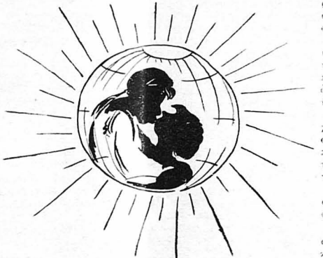
Το φίλ της Αναστάσεως !...

'Ο πρόεδρος της Κοινότητος Ντίνο Τσεραναζάκας