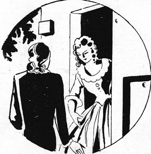
—Ποιά ήταν λοιπόν αυτή ή γυναίκα ; ρώτησε ή Αλύγη.

—Έλιπίστε! έλεγε. Άκουσα καλά! Η πριγκήπισσα μου έπεε: «Έλιπίστε!» Ό! πως είχα άπατηθή γι' αυτή τήν γυναίκα, γι' αυτή τήν άγια!... Μου έπεε: «Έλιπίστε!» Μήπως τής ζήτησα