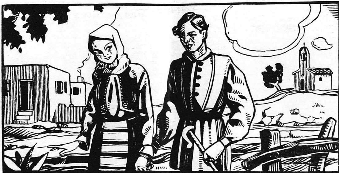
ΑΓΑΠΗ ΣΤΟ ΧΩΡΙΟ