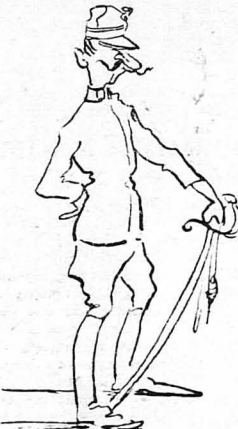
Ο διοικητής του απόσπασματος...