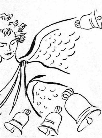
Καμπάνες άπ' όλα τα μέρη τά Έλληνικά, που ό Άγγελος τής Νίκης τις χτυπούσε !

Και χτυπάνε ή καμπάνες άπ' τής Χειμάρρας τις άπότομες ίστές και άπαντών τής Προμετής, κ' άχολογούν του μελανού Άγχιρομάστρου, και δοθούν βαφειές και ήρωές στα Γιάννα, και μπουκιούνται άπό ήγους όλη ή Μακεδονία, Φλώρινα, Βέροια, Γιαννιτσά, Κοζάνη, Έλαιοσσα, Σέρρα, Γρεβενά, Δράμα και Ξάνθη και Καβάλλα, και πλαταμιστό, σάν φουρτούνα ήγουν, έρχεται τής Θεσσαλονίκης τó χαροπό καιμιασούτρημα, σάν ν' άπαντήη στον ήηρό βρόντο των κωδώνων, που έρχονται άπ' τή Θράκη, τήν Άδριανούπολη, τις Σαράντα Έκκλησιές, τή Ραιδεστό και τήν Καλλιόλη, για να χυθή από εκεί κατά τήν Μικρά Άσία και τήν Προδσσα, και από εκεί στην Πάνομο, στη Μαγνησία, τó Άϊδίν, τó Ουσάκ, τó Άδραμύτι, τó Βουρλά, στα νησιά, τή Χίο, Σάμιο, Μυτιλήνη, σάν να θέλη να στεφανώσει τήν ελευθερία Σιώνη και να περάση πού πέρα, μίσημα χαρούς, έλλπδος και ελευθερίας, στα πολιτεπασιαμένα Δωδεκάνησα, τά βοσβία και πισοπία άκόμα, και να ένοθή με τού Καστελλορίζου τών εκκλησιών τούς άργηρούς κωδωνιστές, που άνεβαιώνουν ψηλά στο γηινό και ζώκινο βουνό του, σάν εύχαριστήριοις ειχή προς τόν Θεό, άπ' τή μικρή κ' άπότομη έξαινη άψη τής Ελλάδος... Και είνε και πάλιν όλοι οι έν τέλει στην εκκλησία, όχι οι ίδιοι, οι παλιοί, οι άγαθοί, άλλά άλλοι, παραλήσοι.