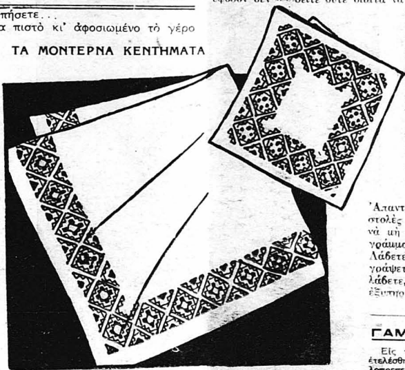
Ψραϊότατο τραπεζομαντηλάκι και πετσέτακι τσαγιού. Κεντιέται με χρωματιστές κλωστές και με κέντημα λευκό και κοφτό.

Ε. Π., Νέαν Κίον.—Φοβούμαι πολύ ότι ό λεκές που κάνετε στο φόρεμά σας είνε ανεξάλειπτος. Σας συνιστώ να πλύνετε διάοληρο τό φόρεμα μέσα σε χλιαρή άφράτη σαπουνάδα και να έπιμείνετε στο πλύσιμο του μιάς γράφει τό όνομα και την διεύθυνση σας.