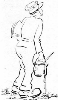
Κρατώντας στα χέρια κάτι πηλινα άγεια...

...Κριμικές μέσα στο πρόζωμα, μπρός στο όποιο ύψόνοντο οι στόχοι της σκοποβολής, συλλογίζοινα το μεσημεριανό σνακτίο, ένα στιφάδο πηγμένο στο λάδι, στιφάδο...σαρωκοστιανό — τί ξφρευτικώς πού γίνεται κανεϊς στο στρατό... 'Ο σνοσιπιάρχης, αν δέν ήταν ηλεκτρολόγος, πρίν καταταγή στο στρατό, θα ήταν ασφαλώς ο 'Εδισσών της 'Ελληνικής κοζίνιας.