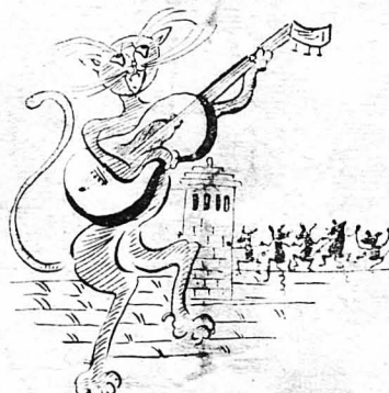
Σάν έρωτησμένοι γάτοι, στα κεραμίδια του Γενάρη...