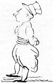
Φαντάροι άπ' όλη την 'Ελλάδα...