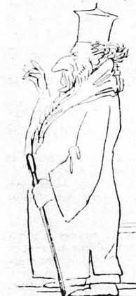
Ούτε θα μάς πάλλη ο Παπαγούγος...

—'Ε, πώς σου φαίνεται ο πόλεμος, στρατιώτη ; πού είτε έξαφνα της Σχολής ο έφφειδος. Γιά φαντάσου να περνούν χιλιάδες σφαίρες από το κεφάλι σου και να ουθλιάζον έτσι !... —Πολύ ενδιαφέρον θέματα ! Και ποιός θα μού τις ρίχνη ; ρώτησα, κώνοντας το χαζό. —'Οι Τούρκοι ! —Ποιοι Τούρκοι ; —'Ο Τούρκικος στρατός. —Σάν πόσος θα είνε ο στρατός αυτός ; —Χιλιάδες, μυριάδες !