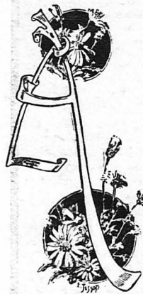
μια κομπανιάζον. Η όψη της ήταν πεταμένη στο πάτωμα...