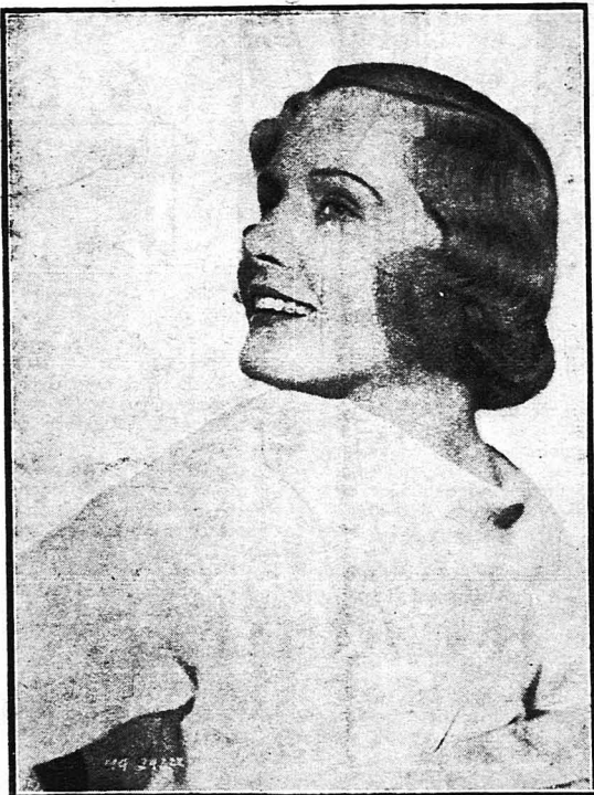
Η Μάτζ' Ηθας

Δεν έχει όρεχο, λοιπόν, ο μιστρο Φρόντζ' Έντοναρντ να λήη ότι ο διεπνήτης του έστιατορίου των «στυντίου» είναι «άν την μητέρα» μιας πολυμελούς και γεμάτης κα-ποίτια οικογενείας;