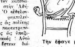
Τήν έφαγε με λεπτότητα...

Ο κοσμοπολιτισμός, η νέες ιδέες ίσως, που τώρα τελευταία, μαζί με εμάς τους νεοσολιζηθέντας, έπληθσαν μέσ' στο στρατό, παρεστράσαν, μαζί με τους άλλους φαντασίους, και τον τετραπόδο εθελοντή, και τον χατέβασαν στην Άθήνα. Ο εθελοντής» σημπελειόντας ως πολίτης και παρεκρεπόμενος ως άποζηματιστός ! Αυτό δέν έστρεξε διόλου στην στοιατιστική άνατροπή του !