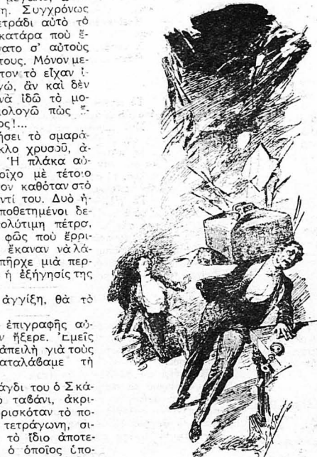
Η θαρειά σιδερένια πλάκα έπεσε άπάνω στους ώμους του...

—Θεέ μου! Το σμαράγδι του Κορμπαγιάν! Ποτέ δεν φανταζόμουν πως θά τώ έβρισκα τόσο γρήγορα!... Άστε σ' είνε ο άθλιος που τολμήσε να τώ κλέψη! Άν και άλλαξε τώ δέσιμό