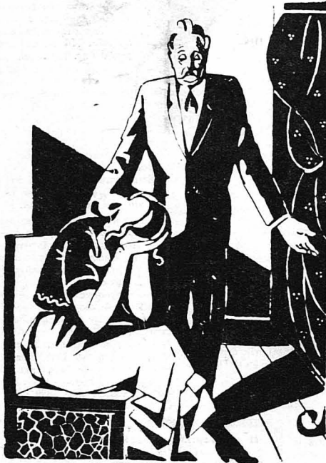
—Πές μου τί θες νὰ κάμω, παιδί μου; μοῦ εἶπε ὁ πατέρας μου.