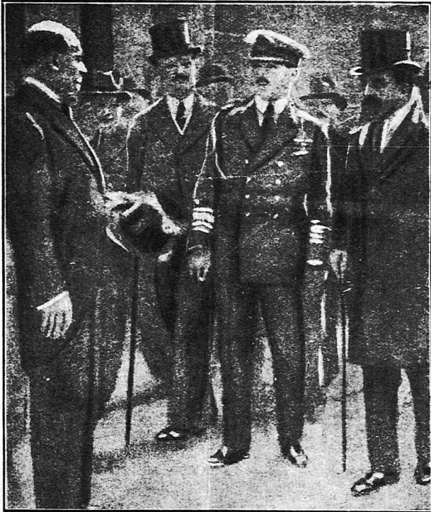
Ὁ βασιλεῦς "Αλέξανδρος, ὁ κ. Μιχαηλάκουλος και ὁ πριγκηπῆς κ. Ρωμαιοῦς στή Παρισι