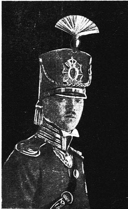
Ο βασιλεύς 'Αλέξανδρος με σπολήν Ουάσάρου

Εύτυχώς όμως τά πράγματα ήρθαν έτσι, ώστε ο 'Αλέξανδρος δεν θρεθήκε στήν ανάγκη να πραγματοποιήσ η τις άπειλές του. Αντιθέτως, μάλιστα. Ένομφεύθη τήν δεσποινίδα Μάνου, όταν έκάσθητο στόν 'Ελληνικό θρόνο, όταν ή μοιραία φάρά τόν πραγμάτωσε τó έφόρσε άπρόσδοτος τó 'Ελληνικό στέμμα, στέμμα θαρού και άκάνηνο για τόν άπλοικό, άφε-