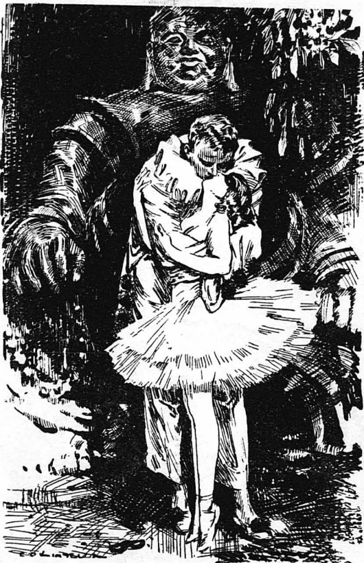
Όρθοί, άπάνω στα γόνατα του Βούδα, οι δυό νέοι έλλαζαν άτέλειωτα φιλιά...

Η δεξιώσις του Μαχαραγιά του Πανινιόν ήταν πράγματι βασιλικές. Η πολυτέλεια των άνακτόρων του και τή άμύθητα πλούτη του ήταν γνωστά σ' όλη τήν μακρινή Άνατολή. Εί-