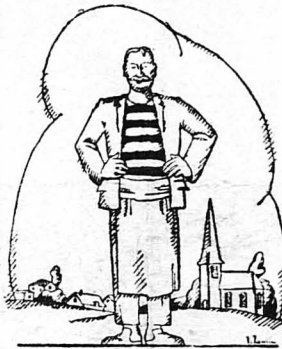
'Ο Γιάννης Μποντρό, ό φούρναρης τού χωριού