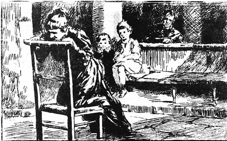
Η κορία Μισού ήταν στην εκκλησία, περιστοιχημένη απ' τα παιδιά της...