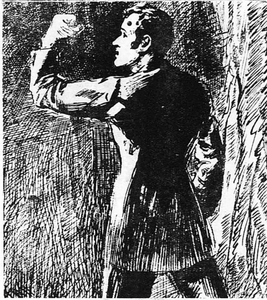
Πάρτατος, παραμιλώντας και χειρονομώντας νευρικά...

πάρτατος, παραμιλώντας και χειρονομώντας νευρικά... Πέντε περίου μήνες ύστερ' από τό δράμα, στις 15 Δεκεμβρίου 1827, ο 'Αντουάν Μπερετέ όδηγητο στο Καζοργουδεζιό της Γρενοβίλης, γιά