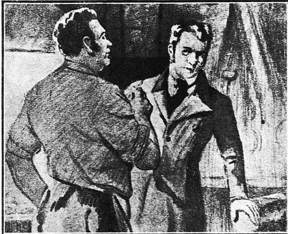
—Εσύ, παιδί μου, δεν θα κάνεις τίποτα στη ζωή σου!..

Με τη σέφι αυτή ο 'Αντουάν πέρας ήθελε φριχτές άγωνίες, σκαλιζοντας περισσότερο με τα ίδια του τα γούα—και με μικρή ήθηον—την αλήγη της καρδιάς του. Περιπατούσε στο δάσιο παρισπώνοντας και χειρονομήοντας νενοιά και άδιασπώνοντας άν ή έρωτική ά-